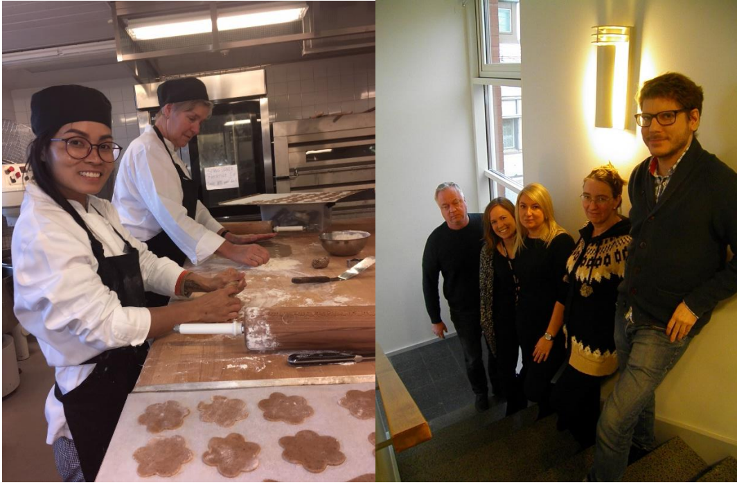
Bilder från kurserna "matlagning och köksarbete" och "jobsökningens ABC".